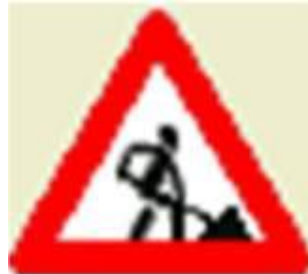
• Дорожные работы