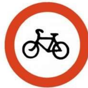
Движение на велосипедах запрещено